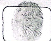
Huella Índice Derecho